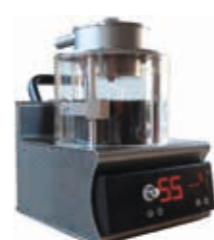
TAS Integral Micro