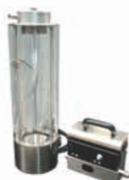
TAS Split Micro